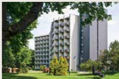
K. Dineikos g. 1