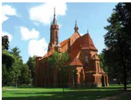
Druskininkų Švč. Mergelės Marijos Škaplierinės bažnyčia, Vilniaus al. 1