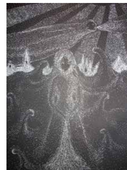
MATAS GUDŽIAUSKAS, 14 m., „Jūra“