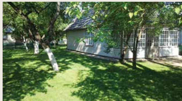
M. K. Čiurlionio g. 35