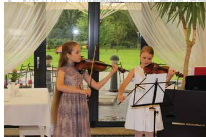
Akimirkos iš 2016 m. festivalio renginio