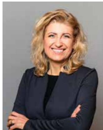
LIETUVOS RESPUBLIKOS KULTŪROS MINISTRĖ LIANA RUOKYTĖ-JONSSON

P asitinkame jau penkioliktą vasarą su tarptautiniu menų festivaliu „Druskininkų vasara su M. K. Čiurlioniu“. Nuo pat festivalio pradžios šie susitikimai tapo įkvepiančių patyrimų, nepakartojamų įspūdžių ir profesionalios muzikos skambesio pripildytomis vasaromis. Džiugu, kad šis festivalis suteikia unikalią galimybę ištikimiems gerbėjams ir augančioms kartoms artimiau ir giliau susipažinti su įvairiapuse mūsų didžiojo genijaus Mikalojaus Konstantino Čiurlionio kūryba ir gyvenimu.