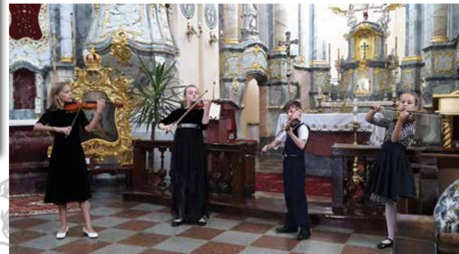
Meistriškumo mokyklos smuikininkai Liškiaivos Švč. Trejybės bažnyčioje. 2016 m.