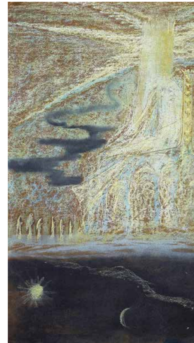
M. K. Čiurlionis. Himnas (fragmentas). Iš ciklo „Himnas“. 1906-1907. Popierius, tempera. 36,8x31,5