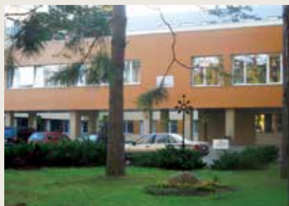
Vytauto g. 2

Liepos 28 d., penktadienį, 16 val. Druskininkų „Saulutė“