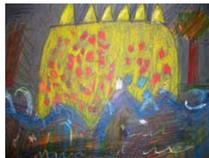
DAINA MATAITĖ, 5 m., „Jūra“

M. K. Čiurlionis, „Vilniaus žinios“, 1908 01 30 (02 12) Nr. 25