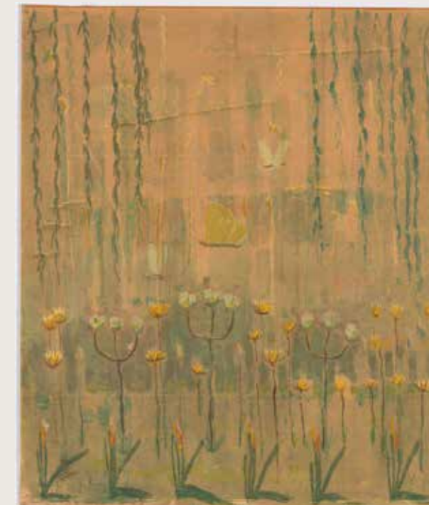
M. K. Čiurlionis. „Gėlių“ arba „Gluosnių“ paveikslas (1907/1908)

Director of M. K. Čiurlionis National Museum of Art