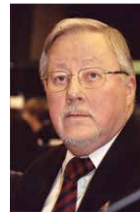
Prof. VYTAUTAS LANDSBERGIS

Linkiu festivaliui ir jo dalyviams kūrybinio polėkio, visiems klausytojams – pakilios nuotaikos ir pilnatvės akimirkų.