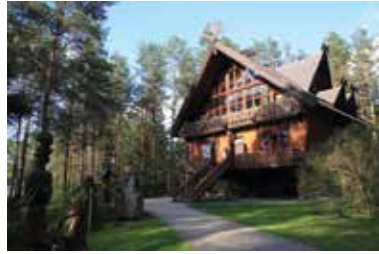
Miško muziejus „Girios aidas“, M. K. Čiurlionio g. 102