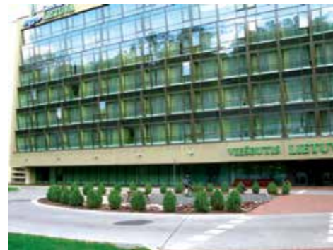
V. Kudirkos g. 45

Šis jaunimo ansamblis yra starto vieta stropiems, profesionaliems muzikantams. Daugelį jo narių šiandien sutiktume Vienos, Miuncheno filharmonijų, Berlyno radijo simfoniniame, Saksonijos valstybiniame Dreseno ir Niujorko Metropolitan operos, kituose žymiausiuose orkestruose.