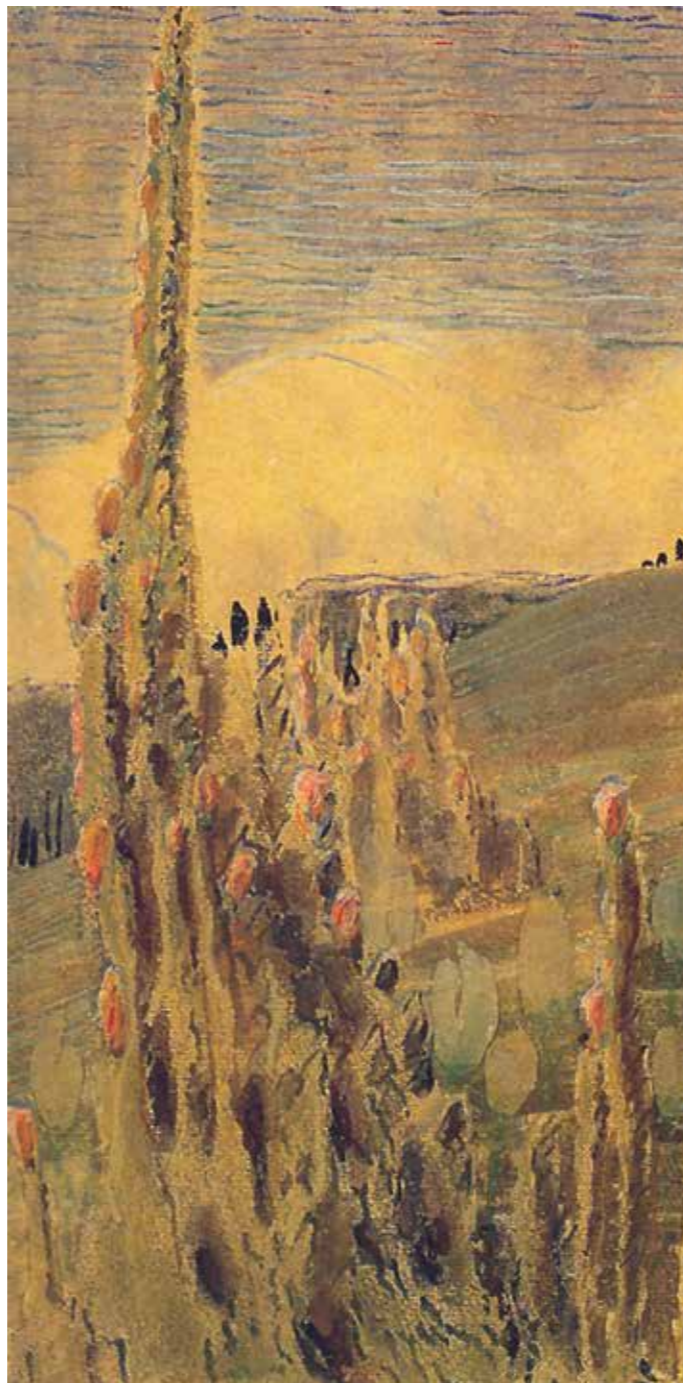
M. K. Čiurlionis. Vasara. III. 1907 (fragmentas)