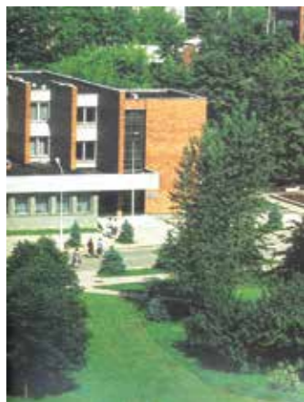
Vytauto g. 23