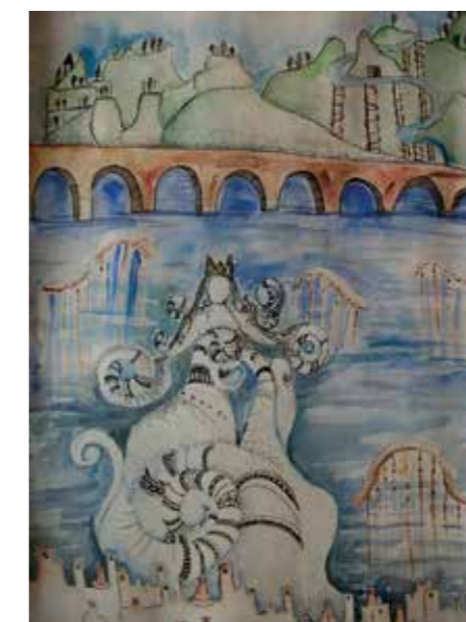
EGLĖ ORLIUKAITĖ, 10 m., „Jūra“