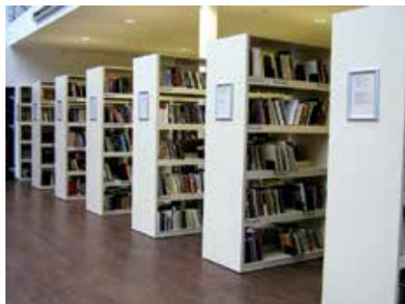
V. Kudirkos g. 13