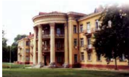
V. Krėvės g. 7