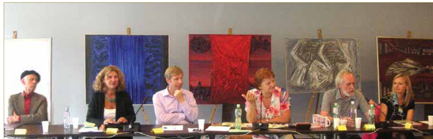
Tarptautinėje konferencijoje „M. K. Čiurlionis ir pasaulis“. 2013 m.

2009 metais įsikūrusiame „Grand SPA Lietuva“ komplekse, siekiant padėti svečiams atkurti fizinę organizmo būklę ir sustiprinti dvasines jėgas, tęsiamos senosios Druskininkų kurorto sveikatinimo ir gydymo tradicijos. Čia teikiamos apgyvendinimo, sveikatinimo, poilsio ir SPA, gydymo paslaugos, organizuojamos vandens ir laisvalaikio pramogos, maitinimas, konferencijos ir renginiai. Komplekse įsikūrusi viena didžiausių ir moderniausių gydyklų Baltijos šalyse, ji turi savo mineralinio vandens šaltinį ir siūlo 110 skirtingų paslaugų bei specialių medicinos procedūrų. „Grand SPA Lietuva“ taip pat veikia unikalus interjero vandens parkas, diagnostikos ir odontologijos klinikos, trijų ir keturių žvaigždučių viešbučių kompleksas, konferencijų centras, laisvalaikio pramogų klubas bei platus restoranų ir kavinių tinklas.