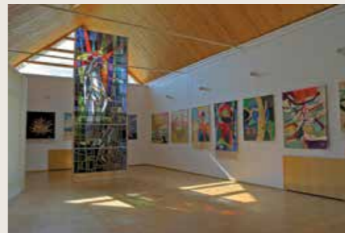
M. K. Čiurlionio g. 41