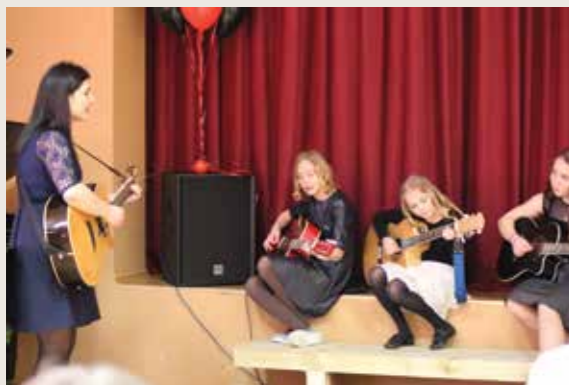
Druskininkų VDC „Džiugučiai“ gitaristės

Druskininkų „Saulutė“ veikia nuo 1953 m. Ji įsikūrusi 5 hektarų pušyne Druskininkų kurorto centre, ant Nemuno kranto. Per metus čia gydoma iki 3000 jaunųjų pacientų iš visos Lietuvos. Vienu metu „Saulutė“ priima apie 220 vaikų.