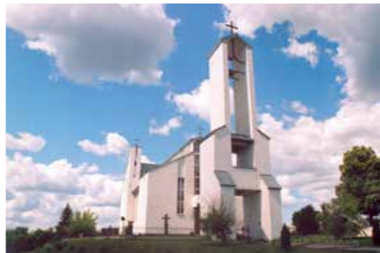
Senosios Varėnos Šv. arkangelo Mykolo bažnyčia, Laisvės g. 21