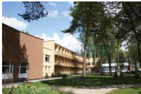
Maironio g. 22