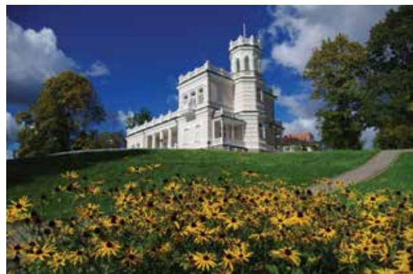
M. K. Čiurlionio g. 59