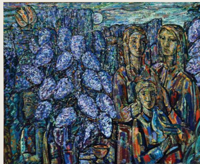
Žydėjimas alyvų. 1975. Drobė, aliejus. 134x162.

Po mirties (1987 m.) apdovanotas Lietuvos valstybine premija.