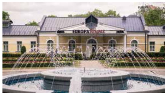
Vilniaus al. 7