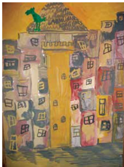
EMILIJA KRUŠAITĖ, 8 m., „Viltis“